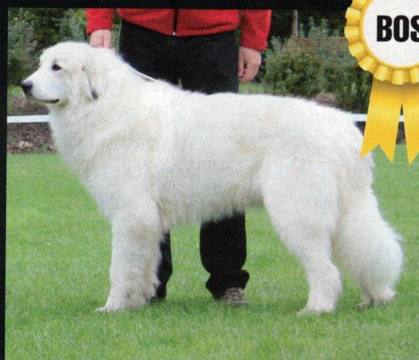
Pyrenejský horský pes Feny – třída otevřená