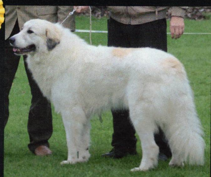
Pyrenejský horský pes Feny – třída šampionů