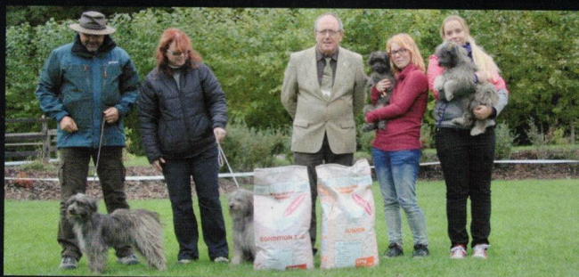
Nejlepší chovatelská skupina