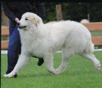
Pyrenejský horský pes Feny – mezitřída