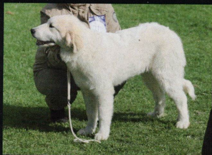
Pyrenejský horský pes Feny – třída štěňat