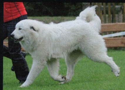
Pyrenejský horský pes Feny – třída mladých