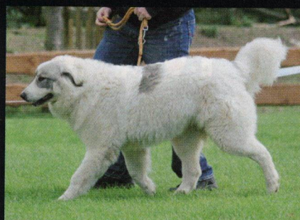
Pyrenejský horský pes Feny – třída dorostu