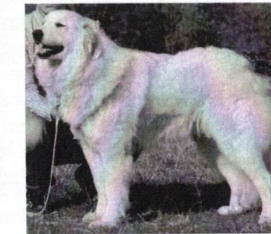
Gaelein du Champ d'Ours - V1, CAC

* Pyrenejský mastin Umberta Lilly de Cabeso Roig