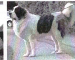
Beethoven from the Elbe Valley - V1, CAC, BOS