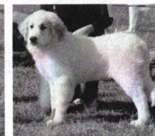
Unique from the Dutch Garden - VN 1