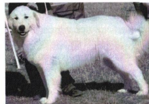
Caoussu Moravský květ - V1, CAC