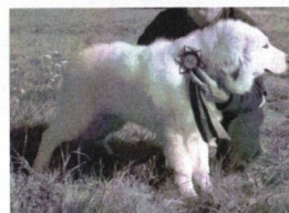
Rodentáli Bagó - VN 1