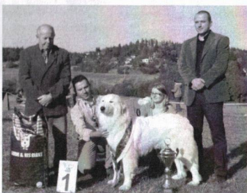
BIS KV Olšany 2012