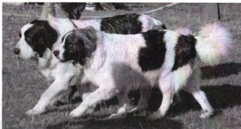
Nejkrásnejší pár PM, Beethoven a Umberta