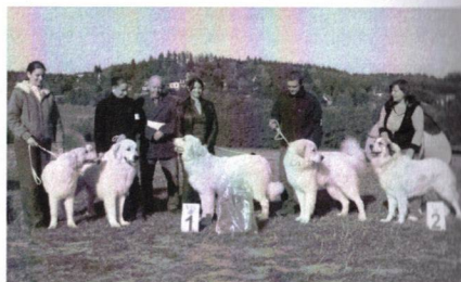
Nejlepší CHS, Moravský květ