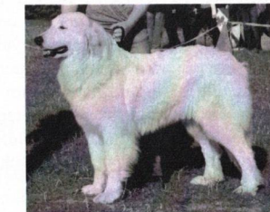
Endaye - V1, CAC, BOB, BIS