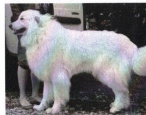
Fieramie du Neouvielle - V1, CAC