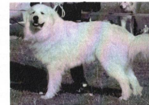
Aron first z Vajlovny - V1, CAC, BOS