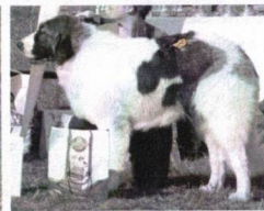
Vally Farma Štětkot - V1, CAJC, BOJ