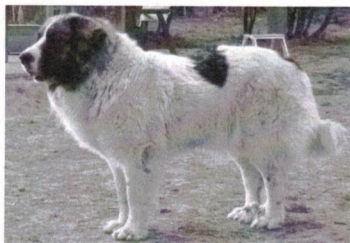
Umberta Lilly - V1, CAC, BOB