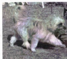
Izák Farma Štětkot - V1, CAC, BOB