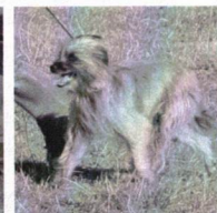
Antoinette - V1, CAC