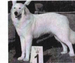
Petty Filipův Dvůr - V1, CAJC, BOJ