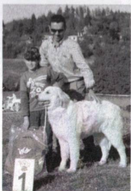
Vítěz soutěže Dítě a pes