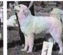
Donamaria Moravský květ - VN