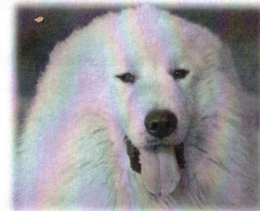
USA import – Arielle's Grizzly Pyrtecton

Hlavným dôvodom bolo vnieŤ do mojich línii isté kvality, ako napríklad korektný pohyb, navyše v súčasnosti sú psy v USA dôkladne zdravotne testované. ★