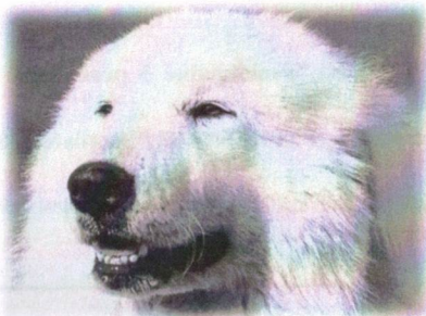
Legendární Neou du Néouvielle

Aktuálne mám 11 PHP, z toho niektorých v spolujateľstve. Moju svorku tvorí 5 psov: Fax du Mas de Beauvoisin, Jao du Mas de Beauvoisin ( účast KV Olšany 2012 – tr. otvorená: V2, res. CAC, pozn. prekladateľa ), Inouck du Mas de Beauvoisin, Arielle's Grizzly Pyrtecton ( import USA – pozn. prekladateľa ), Largo du Mas de Beauvoisin a 6 fien: Endaye des Brumes de la Comté ( účast KV Olšany 2012 – tr. otvorená: V1, CAC, BOB, BIS - pozn. prekladateľa ), Pic d'Anie Pastoure ( import USA – pozn. prekladateľa ), Garonne du Mas de Beauvoisin, Laïs du Mas de Beauvoisin, Laliq du Mas de Beauvoisin, Jimere de la Maison des Patous.