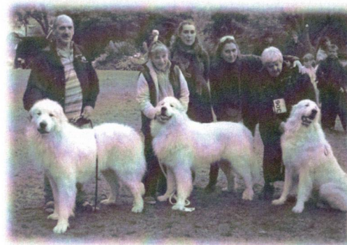
Fax, Fuego a Farley du Mas de Beauvoisin

Samozrejme, bude pre mňa potešením zúčastniť sa Vašej klubovky.