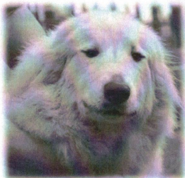
Garonne du Mas de Beauvoisin

Spočiatku bolo veľmi ťažké získať informácie o plemene, keďže neexistoval internet a jediným miestom, kde mohol chovateľ načerpať potrebné informácie, boli výstavy. Navyše bolo obtiažne preniknúť do sveta chovateľov a majiteľov PHP, pretože títo tvorili vskutku uzavretú komunitu.