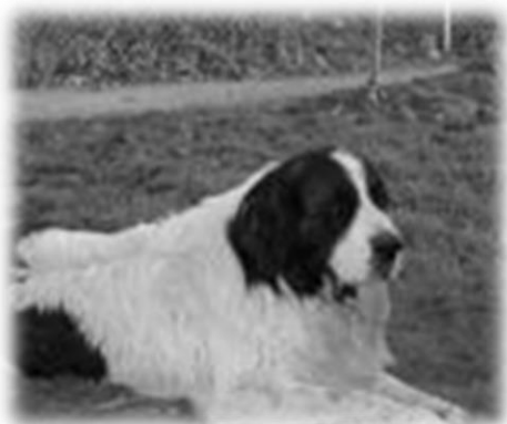
Gino de la Torre de Justo