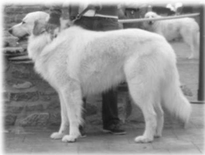
Possets de la Torre de Justo

Skrýva sa za tým naozaj veľké množstvo vykonaných RTG snímkov a najrôznejších zdravotných vyšetrení. Nikdy nepoužívam v chove jedincov, ktorí, i keď sa mi mimoriadne páčia, prenášajú na potomstvo nedostatky a zdravotné problémy. Preto mám doma toľko psov, niektoré z nich neboli nikdy použité na chov, iné naopak často v chove využívam.